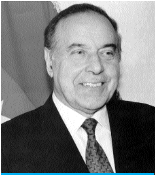
"Ağstafanın füsunkar təbiəti, gözəl insanları vardır". Heydər Əliyev

Ağstafa Rayon İcra Hakimiyyətinin orqanı