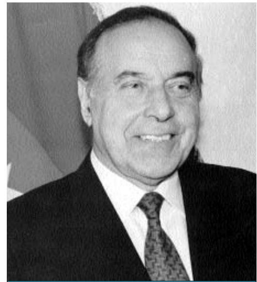
"Ağstafanın füsunkar təbiəti, gözəl insanları vardır". Heydər Əliyev