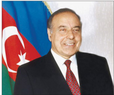
"Ağstafanın füsunkar tabiəti, gözəl insanları vardır"