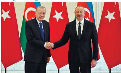
qardaşlıq münasibətlərinin inkişaf edəcəyinə öminliyimizdən sonra da hortorolu ni ifadə edib, əməkdaşlığımızın perspektivləri barədə fikir mübadiləsi aparıblar.