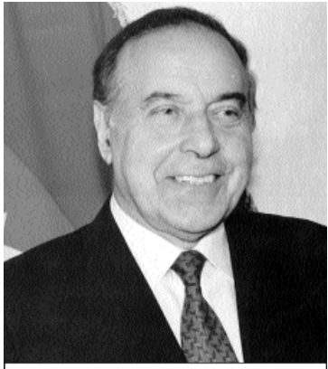
“Ağstafanın füsunkar təbiəti, gözəl insanları vardır”. Heydər Əliyev